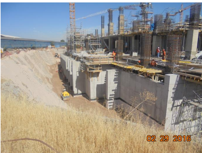
Compactación de relleno en eje 23.