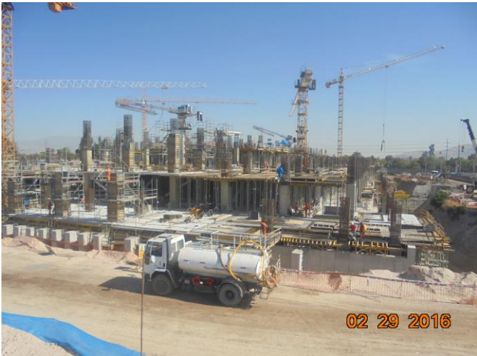
Vista panorámica de ejecución de faenas de obra gruesa en primer y segundo piso.