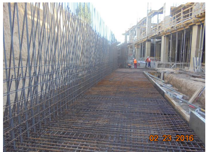
Zapata de muro de contención, eje Q, primer subterráneo. Patio de maniobras.