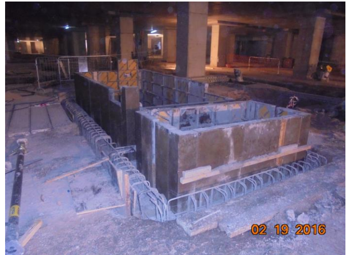
Planta elevadora de aguas servidas en tercer subterráneo.