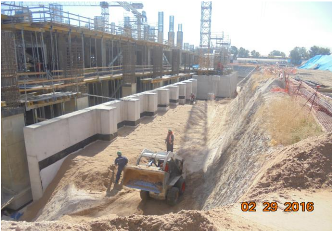
Relleno controlado de muro de contención. En el muro se observa la membrana impermeabilizante (bentonítica) y danodren.