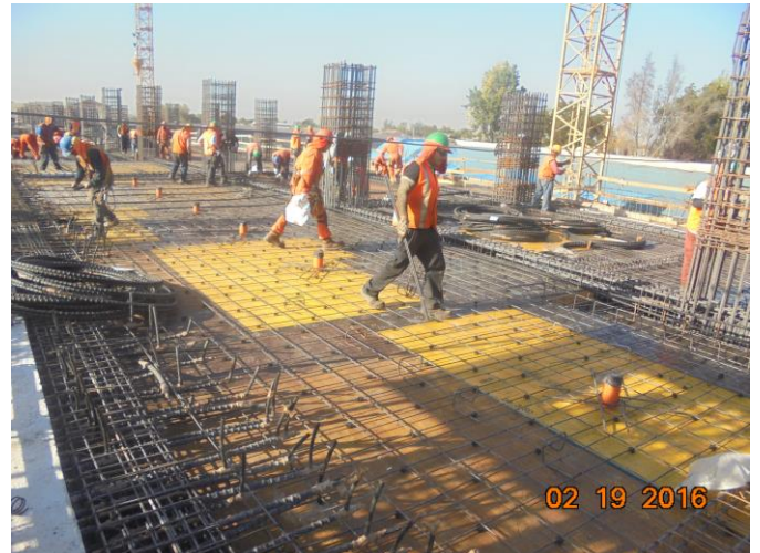
Enfierradura de losa y cables postensados (losa/cielo 2 piso). Pasadas embebidas en hormigón.